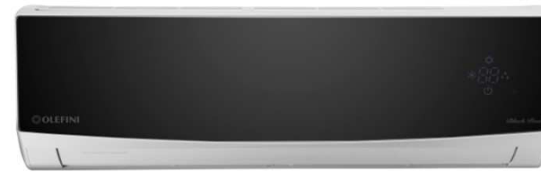
Black Pearl Seri